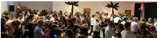
Organizamos na AERLIS Festa mensal e Passagem Ano, p/ dançar e aprender